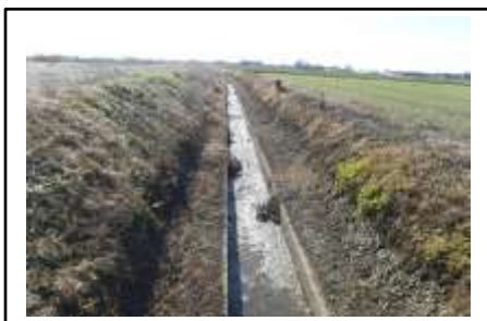
( 現状の水路 )

私たち齋条地区農地環境協議会は、平成19年から23年に『齋条農地環境協議会』としての活動後に休止しており、今年度より名称も新たに活動を再開した団体です。平成20年度に完成した土地改良施設も、10年を経過し水路施設には泥がたまり、未舗装道路はあちこちに陥没が目立ちはじめたので、やはり積極的な施設管理のために多面的活動組織が必要と以前活動していた者同士で認識していたことから、活動を再開する運びとなりました。