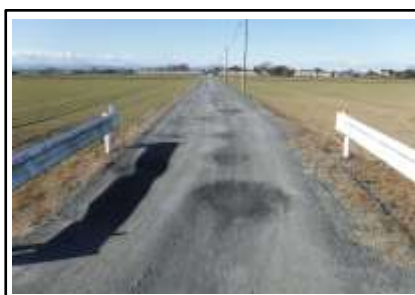
( 現状の道路 )